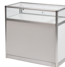
Armoire (avec serrure)